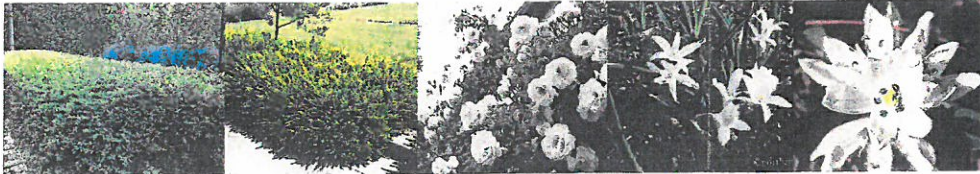
Rahmenpflanzung: Taxus bac. repandens (Eibe), geschnitten ca. 40 cm hoch Lonicera pileata (Heckenkrische) geschnitten oder freiwachsend