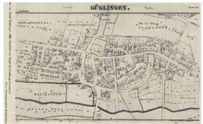
Westlich des Stadtkerns entstand das Neubaugebiet Neuweiler.

Um mehr Abstand zwischen den neuen Gebäuden zu schaffen, wurde westlich der Stadt das Neubaugebiet Neuweiler eröffnet, das in gleichwertige Häuser sowie gerade, rechtwinklige Straßen geviertelt werden sollte. Die Straße, die diesen neuen Stadtteil gliederte, hieß zunächst Neuweiler Straße. Am 4. Juni 1855 besuchte König Wilhelm I. eine halbe Stunde lang die neu aufgebaute Stadt, ließ sich auf einem Rundgang alles Nähere zeigen und sprach sich lobend über den Aufbau aus – schrieb Historiker Gerhard Aßfahl im Heft 1 im Jahr 1974 des Zabergäuvereins. In Erinnerung an diesen Besuch erhielt die Wilhelmstraße ihren Namen.