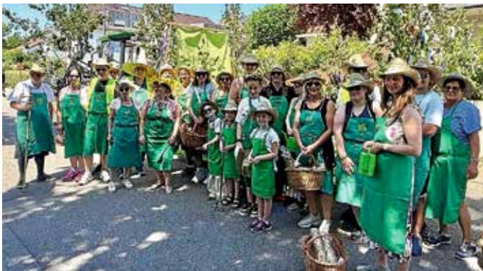
Die fröhliche Truppe

Mit großer Begeisterung und viel Spaß nahm der OGV Güglingen zusammen mit dem OGV Zaberfeld am diesjährigen Maifestumzug teil. Der Umzugswagen war mit bunten Blumen geschmückt, es wurden Schnittblumen sowie Schnäpschen und frisch gepresster erfrischender Apfelsaft verteilt. Die Kinder freuten sich über Kamellen. Die sommerlichen Temperaturen von über 30 Grad konnten die gute Stimmung nicht beeinträchtigen.