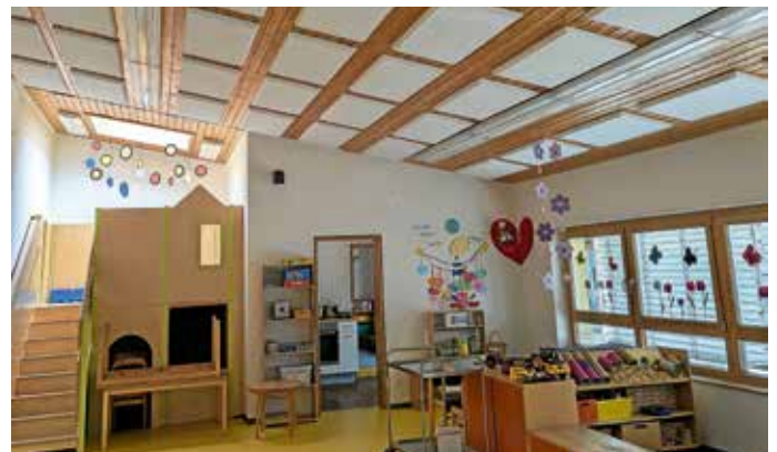
Haus der Strombergzwerge

vergangenen Dienstag war es endlich so weit: Nachdem der Gemeinderat in seiner Sitzung vom 26.02.2026 beschlossen hatte, die Firma Org-Delta aus Reichenbach/Fils mit der Durchführung der Maßnahmen zur Optimierung der Raumakustik in den Kindergärten „Haus der Strombergzwerge“ und „Schneckenvilla“ zu beauftragen, erfolgte in der vergangenen Woche die Montage der entsprechenden Elemente.