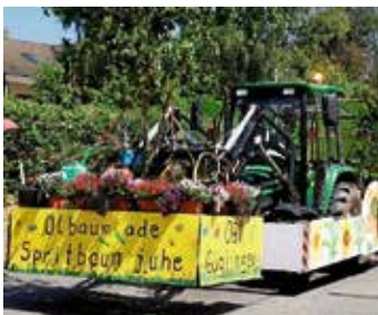
Der Festwagen mit Motto

Danke an alle, die bei der Dekoration des Festwagens mitwirkten und am Umzug teilnahmen. Eine erfreulich große Gruppe, ausgestattet mit grünen Schürzen und Strohhüten, verbreitete gute Laune und sorgte für eine ausgelassene Atmosphäre. Wunderschön anzuschauen waren die Kinder mit ihren Blumenkränzchen.