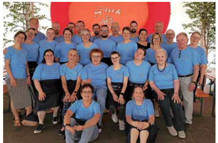
Helferinnen und Helfer der Chöre Frauenzimmerns

Unsere neuen Vereins-T-Shirts kamen beim Maienfest erstmals zum Einsatz: alle Helferinnen und Helfer leuchteten in einem schönen Hellblau, das wunderbar mit den Merchandise-Blumenkränzen des Maienfest e. V. harmonierte. Einmal mehr hatten alle großen Spaß beim gemeinsamen Schaffen, wir freuen uns schon auf das nächste Maienfest. Herzlichen Dank an alle, die uns unterstützt haben, sei es vor Ort oder mit leckeren Ku-chenspenden!