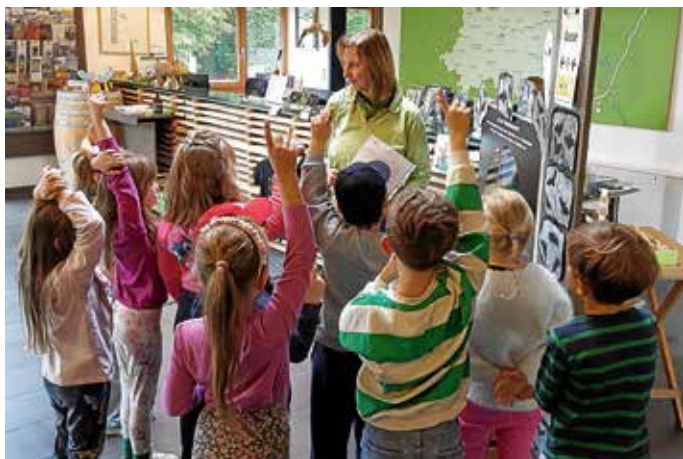
Großes Interesse bei der Führung