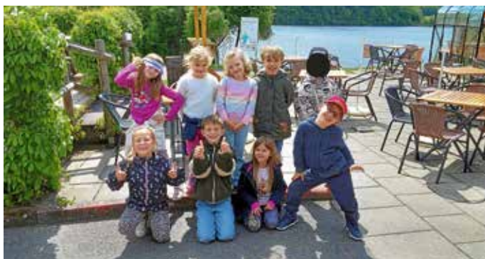
Gute Laune nach den Pommes frites

Kürzlich unternahmen unsere Cleverfantzen einen gemeinsamen Ausflug zum Naturparkzentrum Zaberfeld. Mit dem Bus ging es um 8.26 Uhr ab Güglingen los. In Zaberfeld angekommen, marschierten wir alle einmal um die Ehmetksklinge, bevor wir anschließend im Naturparkzentrum ankamen. Dort gab es eine spannende Führung zum Thema Fledermäuse. Wir durften jede Menge Interessantes über die kleinen Säugetiere erfahren.