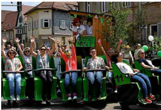
Fantasievolle Wagen werden am Pfingstmontag beim Festumzug durchs Städtle ziehen.

Zwischen Freitag, 22. Mai, 13.30 Uhr bis Sonntag, 7. Juni (Betriebsende) kann die Haltestelle Güglingen, Schulzentrum nicht angefahren werden; die Busse der Linie 663 halten an der Haltestelle Güglingen, Kirche bzw. an der Haltestelle Güglingen, Neues Rathaus. Während der Sperrdauer des Festumzugs am 25. Mai im Zeitraum von 13.15 bis 16.00 Uhr können die Bushaltestellen in Pfaffenhofen und Zaberfeld nicht bedient werden. In Güglingen werden nur die Haltestellen Güglingen Ost (Linie 661) und Güglingen Ochsenwiesenstraße (Linie 663) zum Beginn bzw. Ende der Fahrt angefahren.