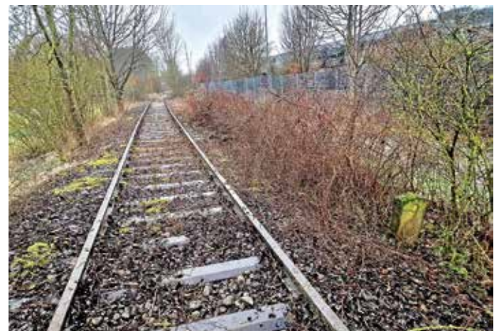
Reaktivierung für's Zabergäu

Mit der Heilbronner Stimme, die sich am Dienstag, 5. Mai, am bundesweiten Tag des Lokaljournalismus beteiligt, ist der Verein „Zabergäu pro Stadtbahn“ auf einer Radtour bis nach Zaberfeld entlang der ehemaligen Zabergäubahnstrecke unterwegs. Um 9.45 Uhr begrüßt Bürgermeisterin Sarina Pfründer die Gruppe am Bahnhof in Lauffen. Start ist am Dienstag, 5. Mai, um 10.00 Uhr. Teilnehmer können auch nur einen Teil der Strecke mitfahren. Gegen 11.30 Uhr am Bahnhof in Güglingen gibt es eine Anschlussmöglichkeit.