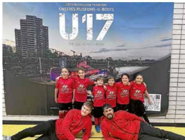
Unsere GSV Bambinis

Nicht nur aus sportlicher Sicht war das Turnier ein voller Erfolg, das Speisenangebot war zwar vielseitig, letztendlich rechnete man aber nicht mit so einem Ansturm, weshalb man am Sonntag um 16.00 Uhr speisentechnisch leider komplett ausverkauft war. Auf der einen Seite war man traurig, dass man den Gästen nicht noch weitere Speisen anbieten konnte, auf der anderen Seite ein großer Erfolg und eine Bestätigung der tollen Arbeit aller Helfer rund um das Turnier.