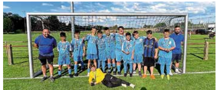
Die D-Junioren der SGM Güglingen – Frauenzimmern