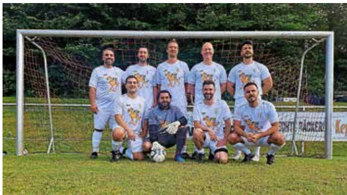
GSV Eibensbach AH