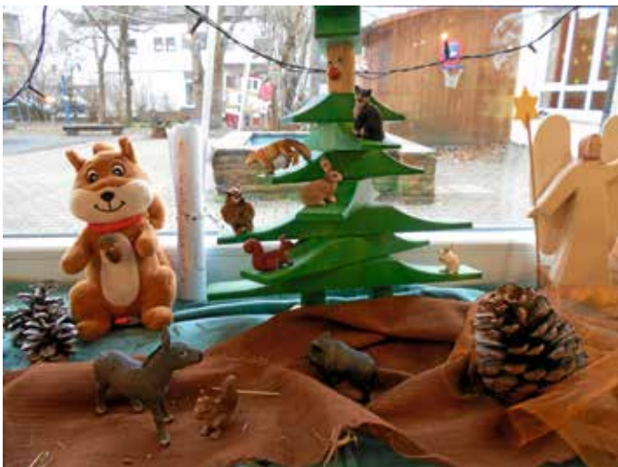
Fibi das Eichhörnchen und die Tiere

Am 3. Advent gestaltete der Gottlieb Luz Kindergarten den Familiengottesdienst. Mit Fibi, dem Eichhörnchen, machten sich alle gemeinsam auf die Suche nach der Bedeutung des Weihnachtsfestes. Schon 2 Wochen zuvor begleitete Fibi die Kinder. Zusammen erfuhren sie von der Eule, der Katze, den Mäusen und dem Wildschwein etwas von Weihnachten.