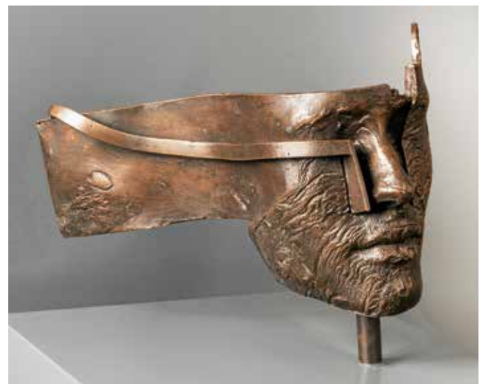
Gunther Stilling: „Schwarze Ophelia“ (2001)

Knapp drei Monate lang, bis zum 24. März, besteht noch Gelegenheit, die aktuelle Sonderausstellung mit rund 80 Werken Gunther Stillings zu besichtigen.