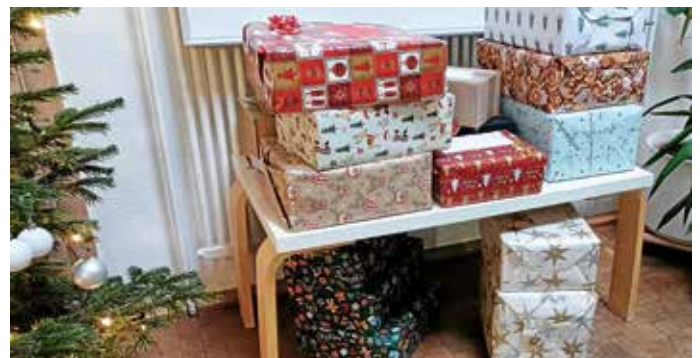
Aktion „Päckchen schenken Weihnachtsfreude“

Auch am Sammeln und Spenden für bedürftige Menschen in der Region haben sich wieder viele Eltern und auch Kolleg/-innen beteiligt. Ein herzliches Dankeschön für diese Unterstützung!