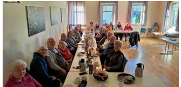
Weihnachtsfeier zweites Frühstück, immer dienstags 9.00 Uhr Gemeindehaus Pfaffenhofen. Herzliche Einladung an „alle“.

Kurzfristige Programmänderungen können möglich sein.