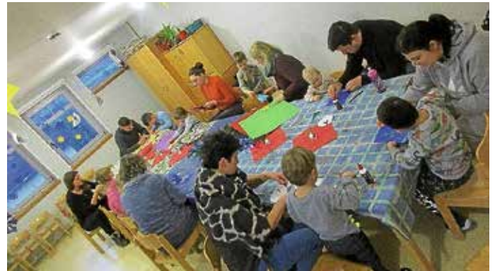
Fleißige Kinder und Eltern beim Adventsbasteln in der Kita

Die stimmungsvolle (Vor)Weihnachtszeit wurde in der Kita Heigelinsmühle mit Liedern, Fingerspielen und der Weihnachtsgeschichte in den Morgenkreisen begleitet. Außerdem konnten die Eltern an angebotenen Bastelnachmittagen Zeit mit ihren Kindern in der Kita verbringen und gemeinsam Weihnachtsdekoration gestalten. Wir haben uns sehr über die große Teilnahme gefreut!