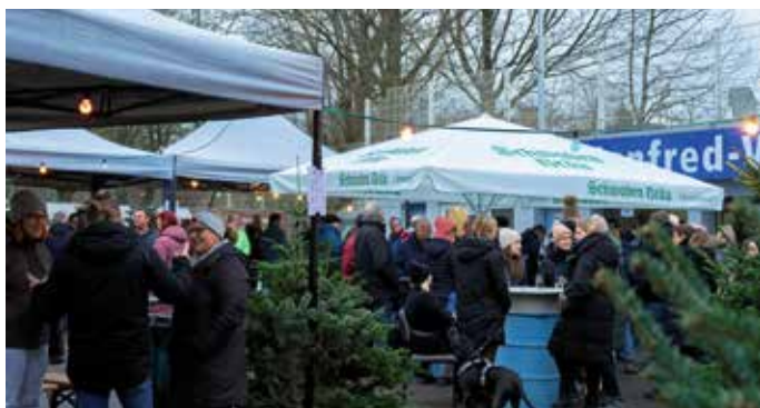
Der Silvestertreff wird jedes Jahr sehr gut besucht