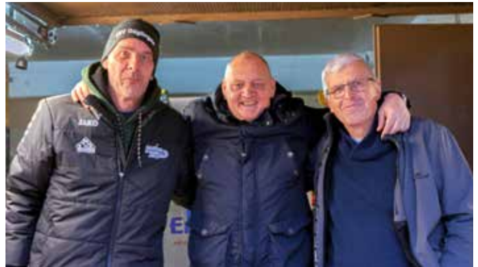
Auch an der Getränkeausgabe stand ein eingespieltes Team.