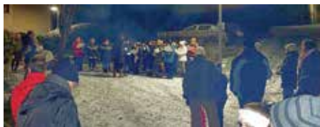
Chor Classic und enVogue

Im Anschluss an den musikalischen Teil, gab es Glühwein, Punsch und Weihnachtsgebäck, sowie gute Gespräche und ein gemütliches Beisammensein.