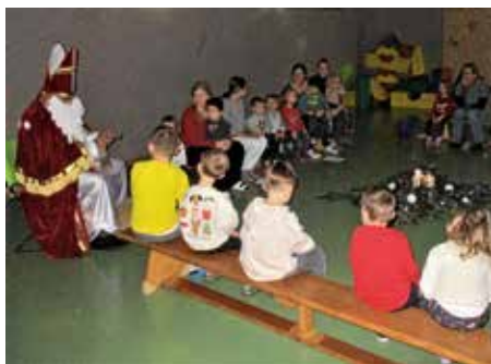
Bischof Nikolaus in der Heigelinsmühle

Heute machten die Kinder der Heigelinsmühle große Augen, als Bischof Nikolaus zu Besuch kam. Alle hatten sich in der Turnhalle versam- melt und ein Nikolaus-Lied angestimmt, als er tatsächlich persönlich vorbeischaute! Ehr- fürchtig lauschten die Kinder und waren über- rascht, was der Nikolaus alles über sie wusste.