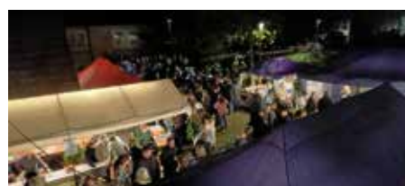
Gut gefüllt: Der Backhausplatz von oben