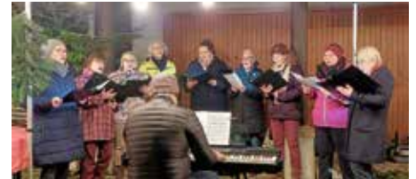
Der Eibensbacher Chor „sing4fun“ beeindruckte mit stimmungsvollen Liedern