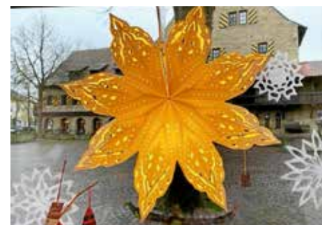
Schneeflocke aus Indien

Abseits des am Rathaus stark bevölkerten Weihnachtsbummels schmückten wir mit unserem weihnachtlich dekorierten „eineWelt-derLaden“ maßgeblich den Deutschen Hof. Von unseren Kunden hörten wir am letzten Sonntag oft, dass es schade sei, dass dieser geeignete Ort nicht mehr in das weihnachtliche Geschehen einbezogen wird.