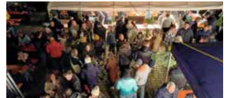
Wohlfühlatmosphäre rund ums Backhaus