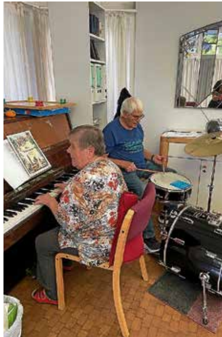
Musik und Tanz im Pavillon

ren und dies sicher nicht nur im Kalender der Bürgermeisterin. Allein in den letzten 10 Tagen waren 4 Jahreshauptversammlungen angesetzt, bei Stromversorgung, Wasserversorgung, Wirtschaftsförderung und auch bei unserem Rechenzentrum KommOne. Wichtige Partner für die Daseinsvorsorge unserer Gemeinde, Zukunftsentscheidungen sollten daher vor Ort mitentschieden werden.