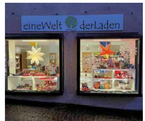
Schaufenster des „eineWelt-derLaden“

Mit ihnen können Sie die Sonne tanken und diese Energie speichern. Diese Lichtquellen geben jetzt vor allem in der dunklen Jahreszeit eine angenehme, von der Sonne gespendete Helligkeit in unser Zuhause. Und Sie haben auch im Notfall eine kostenlose Lichtquelle zur Verfügung!