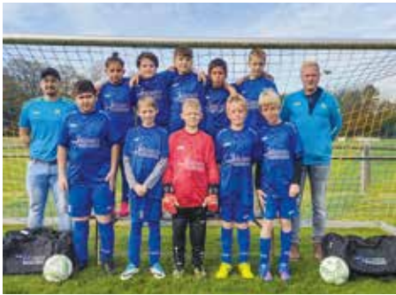
Die D-Junioren des TSV Pfaffenhofen präsentieren sich stolz mit ihren neuen Trikots. Bei jedem Spieler steht der Name auf dem Rücken.