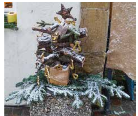
Ob die Bäumchen in diesem Jahr mit Schnee geschmückt werden?

Der Weihnachtsbummel nähert sich in großen Schritten. Wer teilnehmen möchte, sollte sich nächste Woche bei Serina Hirschmann im Rathaus melden.