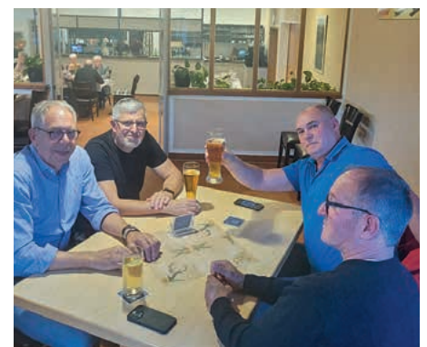
Heitere Gespräche unter langjährigen Mitgliedern.

Der Vorstand bedankt sich bei allen Anwesenden für den wunderschönen Abend.