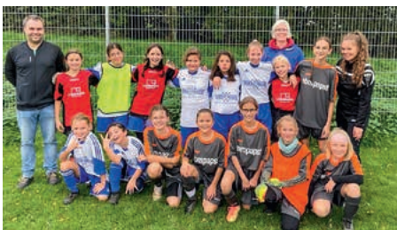
Die TSV-Fußball-Mädchen belegten Platz 3, 6 und 8 in Fürfeld.

Letzten Samstag nahmen unsere E- und D-Juniorinnen erstmals an einem Spieltag beim TSV Fürfeld teil. Weil so viele begeisterte Mitspielerinnen der Abteilung Mädchen- und Frauenfußball dabei waren, konnten wir gleich zwei Teams stellen und zusätzlich zwei Mädchen in eine für das Turnier spontan gegründete Spielgemeinschaft mit Fürfeld abgeben.