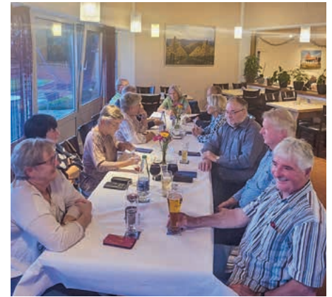
Im Gasthaus Weinsteige wurden die Gäste des TSV mit kulinarischen Köstlichkeiten verwöhnt.