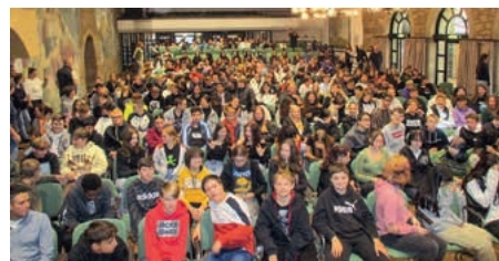
Schülerversammlung in der Herzogskelter

Wenn man alle Schüler und Schülerinnen der Realschule Güglingen in der Herzogskelter versammeln und in einer Vollversammlung über etwas informieren will, dann muss man die Schülerschaft sinnvollerweise in zwei Hälften aufteilen, damit überhaupt alle einen Platz bekommen. Dies war nun seit der Coronazeit erstmalig wieder in dieser Form möglich und fand am Mittwoch, den 12.10.2022 statt.