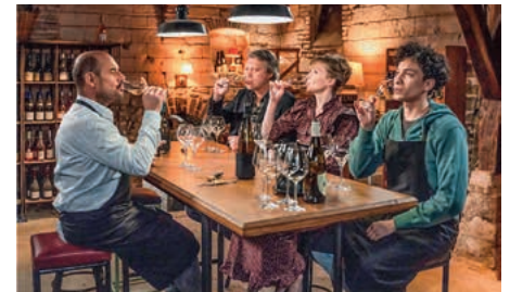
Weinprobe für Anfänger

Ein neuer Mitschüler verliebt sich in Lotta. Und in der Jugendherberge beginnt es zu spucken. Um 17.30 Uhr folgt „Der Gesang der Flusskrebse“. Grandiose Literaturverfilmung um ein Mädchen, das alleine in den Sümpfen aufwächst und als junge Frau verdächtigt wird, einen Mord begangen zu haben.