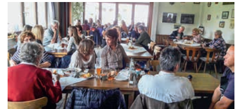
Kirwe im Jahr 2017

Leckere Wildgerichte, dazu feine Tröpfchen von heimischen Winzern läuten den Herbst beim SV Frauenzimmern ein. Freunde und Gäste sind wieder herzlich eingeladen, am 22. und 23. Oktober im Vereinsheim in der Riedfurt zum Essen vorbei zu schauen. Da es wahrscheinlich wieder gut besucht sein wird, bittet das Team um Reservierung.