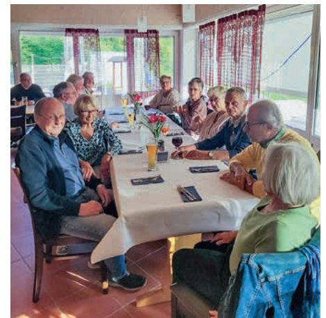
In lockerer Atmosphäre wurden viele Geschichten aus früherer oder aktuellen Zeit ausgetauscht.