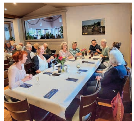
Alle Gäste hatten sichtlich Spaß.