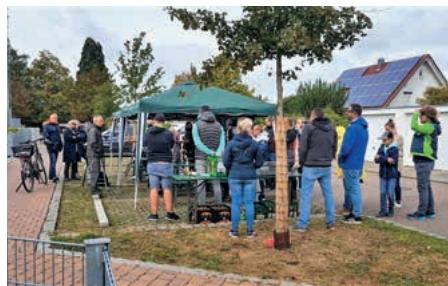
Bürgerfrühschoppen und Dialog

Hatten die von der BU zunächst vermittelten Kontakte keinen Erfolg, so waren sie doch Anstoß für das Engagement des Bürgermeisters zu Sicherung und Ausbau der medizinischen Versorgung mit Allgemeinärzten und weiteren Fachärzten. Medizinnaher Fachberufe, z. B. Hebammen sind ebenfalls Herausforderungen, denen sich der Bürgermeister annimmt. Allgemeinärzte und Kinderärztinnen sind schon mal erfolgreich angesiedelt, oder sie werden ihre Praxen eröffnen.