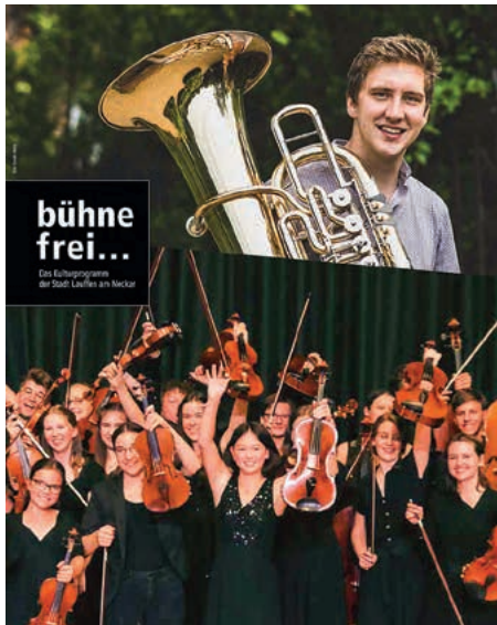
Strings meet Tuba

Nach der Coronazwangspause freut sich das Junge Kammerorchester Tauber-Franken e. V. wieder in Lauffen konzertieren zu dürfen. Am Samstag um 19 Uhr können Sie bei freiem Eintritt die jungen Talente in der Stadthalle mit Werken von Mozart, Plau und Atterberg hören.