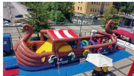
Das Hüpfpiratenschiff wird neben der Mediothek aufgeblasen.