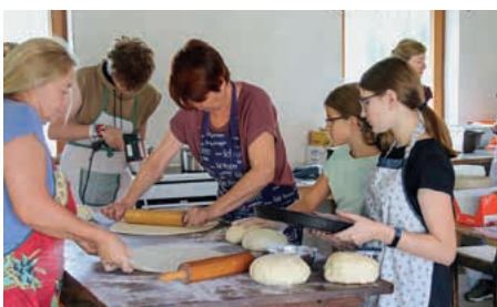
Groß und klein, jung und alt – alle helfen mit!

Wir bedanken uns ganz herzlich bei allen Helferinnen und Helfern, die egal in welcher Form, an welchem Ort und in welchem Ausmaß zum Gelingen unseres Zwiebelkuchenfestes beigetragen haben. Es ist nicht selbstverständlich, dass sich eine so große Anzahl an freiwilligen Helfern findet und wir sind Jahr um Jahr dankbar, dass sich so viele Mitglieder und Freunde des Gesangvereins für diesen Anlass zusammen tun.