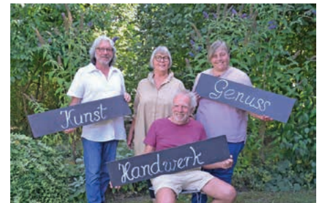
... an der Eibensbacher Straße in Güglingen

an der Eibensbacher Straße in Güglingen am Samstag, 10. September von 14–20 Uhr und Sonntag, 11. September von 11–18 Uhr