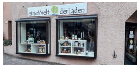
11 Jahre „eineWelt-derLaden“

Am Sonntag, 11. September findet in Güglingen wieder der Naturparkmarkt statt. Auch wir beteiligen uns mit einem Tag der offenen Tür von 11 bis 18 Uhr daran. Seit bereits 11 Jahren sind wir in Güglingen mit unserem Fachgeschäft des Fairen Handels vertreten.