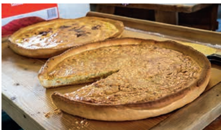
Zwiebel- und Kartoffelkuchen

Insgesamt 569 Zwiebel-, Kartoffel- und Schlutenkuchen wurden am Samstag vorbereitet, gebacken und teilweise bis weit übers Zabergäu hinaus verkauft, denn es hat sich längst herum gesprochen, dass die Frauenzimmerer Kuchen ganz besonders schmackhaft sind.