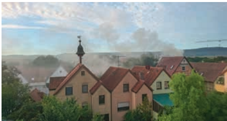
Qualm über Frauenzimmern

Wenn Anfang September die Feuerwehr zu einem vermeintlichen Kaminbrand in die Brackenheimer Straße gerufen wird, dann wissen zumindest die Frauenzimmerer, dass es sich dabei nur um das qualmende Backhäuschen handeln kann, das für's Zwiebelkuchenfest vorbereitet wird.