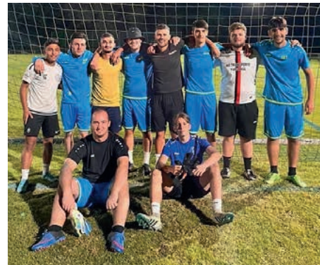
Das Team FC Youngstars jubelte nach dem mit 4:2 gewonnenen Finale und nahm freudestrahlend das Preisgeld entgegen.

ging gegen den FC Kongo sang- und klanglos mit 0:3 unter. Spannend machte es das Team GOATS beim 6:5-Sieg gegen Ferdinand.