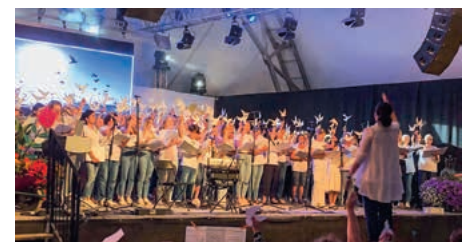
Alle Chöre singen gemeinsam die Friedenshymne von Udo Lindenberg und lassen Friedenstauben aufsteigen.

Um ehrlich zu sein, lässt sich die Stimmung während des dreistündigen Konzerts im Nachhinein gar nicht in Worte fassen. Die Adjek-