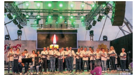
Chor Classic, Only Men und Folklore-Ensemble