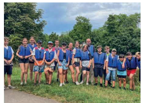
Konfirmanden Kanufahrt 2022