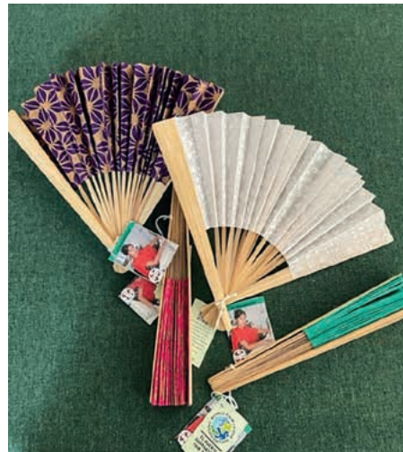
Handfächer aus Bangladesch

örtlichen Textilindustrie im Sinne von Slow Fashion zu hochwertigen Taschen – natürlich unter guten Arbeitsbedingungen und fairen Preisen. Vor allem Frauen werden dadurch finanziell gestärkt und das lässt ihre Selbstbestimmung und ihr Selbstbewusstsein wachsen. Sie erhalten bei „Prokritee“ denselben Stücklohn wie die Männer, und der liegt über dem regionalen Durchschnitt! Die Produzent/-innen können an Weiterbildungen oder Alphabetisierungskursen teilnehmen und erhalten z. B. Rentenfonds oder Kleinkredite durch die Fairhandelsorganisation. Diese arbeitet nicht gewinnorientiert; wenn es dennoch gelingt, Gewinne zu erwirtschaften, fließen diese in einen Fonds ein, der als Altersvorsorge dient. „Prokritee“ wurde 2001 gegründet und ist Mitglied der „World Fair Trade Organization“ (WTO).