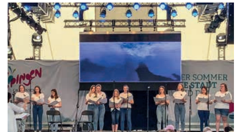
Young Vogue und pepperonis