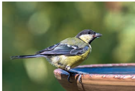
Kohlmeise an einer Wasserstelle

Es empfiehlt sich bei dieser Wetterlage mehrere Wasserstellen aufzustellen. Für eine reine Insektenwasserstelle sollten im Wasser des Topfuntersetzers große und kleine Steine liegen, damit die Insekten nicht ertrinken.