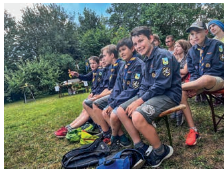
Die Jungpfadfinder (Jufis) beim Gottesdienst.

Am 10.07. waren wir beim Gemeindecafé der evangelischen Kirchengemeinde Zaberfeld-Michelbach. Nach dem Gottesdienst versorgten wir die Teilnehmer mit Grillwürsten und Waffeln direkt vom Feuer. Die Jufis haben beides weitestgehend alleine gemacht, dafür ein großes Kompliment! Und ein großes Dankeschön an unsere Gemeinde für diesen tollen Nachmittag!