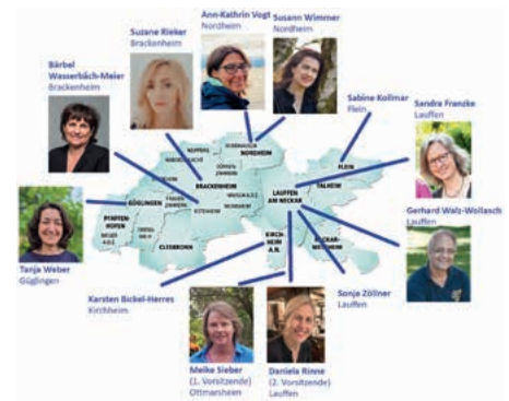
Elternbeirat Musikschule 2022

Wir freuen uns über jeden, der sich bei uns einbringen möchte! Zu erreichen sind wir per E-Mail: elternvertretung@lauffen-musikschule.de .