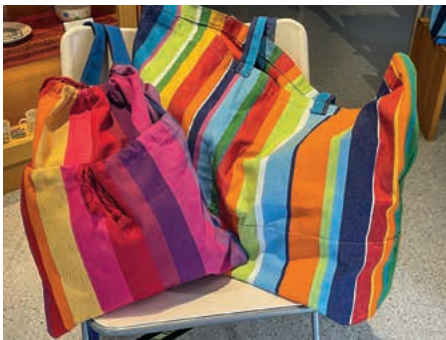
Baumwolltaschen aus El Salvador

Das Familienunternehmen EXPORSAL in El Salvador wurde 1974 gegründet und organisiert seitdem die Produktion und den Vertrieb von traditionell salvadorianischem Handwerk mit einem Schwerpunkt auf Hängematten und gewebten Taschen. Aktuell betreut die Organisation ca. 30 Werkstätten mit insgesamt ca. 200 Produzent/-innen.