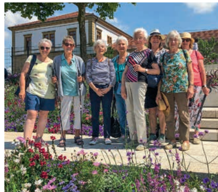
Güglinger LandFrauen genießen ihren Besuch bei der Gartenschau in Eppingen