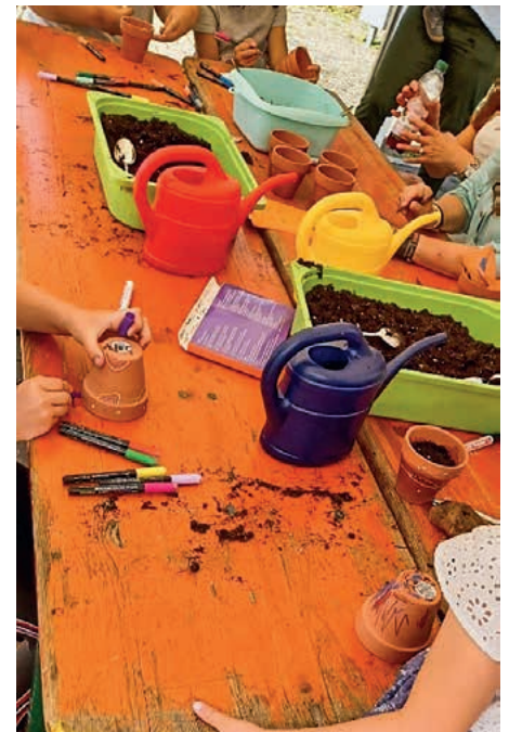
Blumentöpfe beim Kiga Haselnussweg

Insgesamt war es ein tolles Fest mit neugierigen Kindern, die Lust am Gestalten und Ausprobieren hatten!