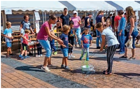
Riesen-Seifenblasen beim ev. Kiga Frauenzimmern