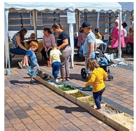
Der Barfußpfad der Kita Heigelmühle