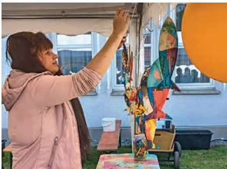
Die marmorierten Fische der ev. Kita Gottlieb-Luz