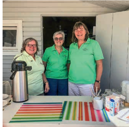
Im Einsatz für die LandFrauen