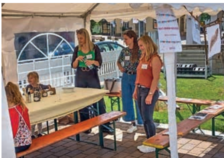
Malen mit Erdfarben bei den Waldelfen