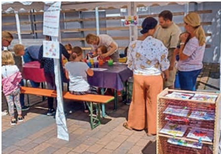
Die Farbmonster der Kita Herrenäcker