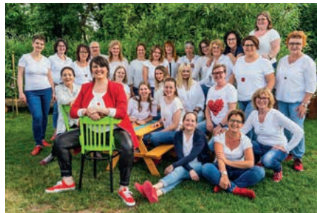
Frauenchor En vogue