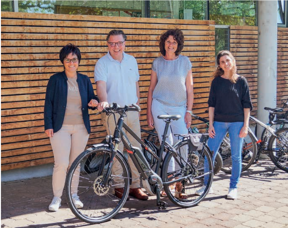
Alle drei Kommunen des GVV Oberes Zabergäu sind wieder beim STADTRADELN dabei.

Mediothek Güglingen – Literarischer Spaziergang Schwäb. Albverein – Halbtageswanderung „Mittwochswanderer“