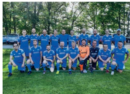
Die AH-Fußballer des TSV Güglingen treffen im Pokalfinale auf den SC IIsfeld.

Die AH-Fußballer Ü32 des TSV Güglingen sind durch einen 2:1-Sieg gegen den TSV Botenheim ins Pokalfinale eingezogen. Das Finale findet am Donnerstag, 16. Juni, statt. Anpfiff ist um 13 Uhr in Brackenheim. Gegner ist der SC IIsfeld.