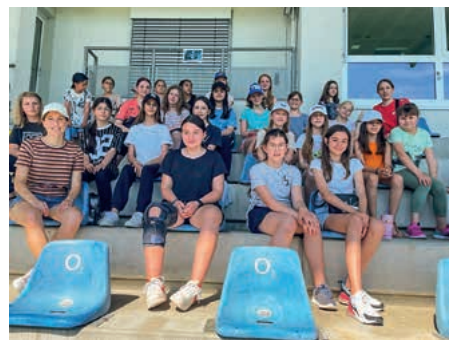
Die TSV-Mädchenfußballerinnen fieberten mit den Fußballerinnen am letzten Spieltag im Stadion in Hoffenheim.

Die neue gegründete Mädchenfußballabteilung hat ihren ersten Ausflug unternommen. Bei strahlendem Sonnenschein haben sich 24 Nachwuchskickerinnen und neun Fahrer/-innen auf den Weg nach Hoffenheim zum letzten Spieltag der Flyeralarm Frauenbundesliga auf den Weg gemacht. Die Ausflügler sahen im Dietmar-Hopp-Stadion ein unterhaltsames Spiel der TSG Hoffenheim gegen den SC Sand. Natürlich durfte bei diesem Wetter die eine oder andere Abkühlung in Form von Getränken und Eis nicht fehlen. Das Ergebnis war bis zum Schluss offen sodass alle kräftig mitfieberten, kurz vor dem Schlusspfiff netze die TSG Hoffenheim dann zum 3:3-Endstand ein. Meike Neumann vom Mädchen- und Frauenfußball bedankt sich herzlich bei allen Eltern, die das Team begleitet und so diesen Ausflug möglich gemacht haben.