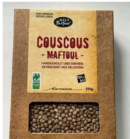
Couscous aus Palästina

Couscous ist eine Alternative zu Reis oder Kartoffeln, schmeckt zu Fleisch, Gemüse, als Salat und auch als Süßspeise – und ist in Minuten zubereitet!