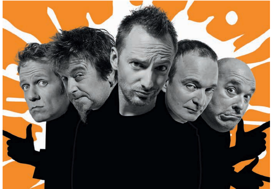
FÜENF - 005 im Dienste ihrer Mayonnaise