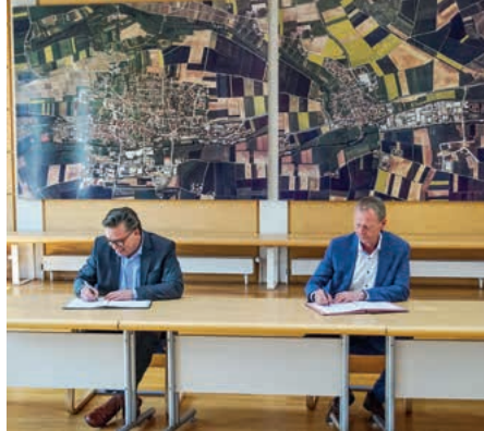
Der neue Vertrag mit den Stadtwerken Bietigheim-Bissingen tritt am 1. April in Kraft.

Was vor einigen Wochen in der Verbandsversammlung des GW beschlossen wurde, konnte gestern im Sitzungssaal des Rathauses nun auch offiziell besiegelt werden: