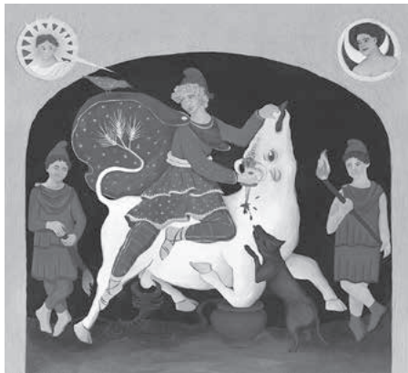
Das farbige Kultbild von Mithräum II.

Gelungene Einweihung: Farbige Kultbildrekonstruktion in Mithräum II feierlich enthüllt