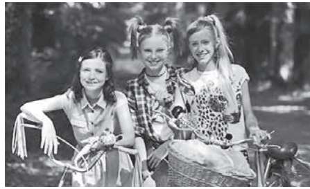
Die drei !!!

Die Lichter flackern, es sind seltsame Geräusche zu hören und auf dem Schminkspiegel findet sich wie durch Zauberhand plötzlich eine bedrohliche Nachricht. Ein Fall für die drei Nachwuchs-Ermittlerinnen Franz, Kim und Marie – und die geben nicht auf, ehe der Fall gelöst ist!