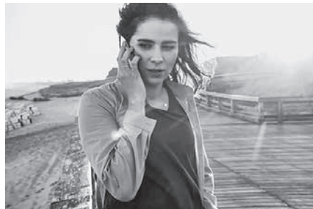
Gut gegen Nordwind

Ein falsch gesetzter Buchstabe und schon landet die E-Mail von Emma Rothner (Nora Tschirner) unbeabsichtigt bei Leo Leike. Leo antwortet. Weil sich die beiden nicht kennen, vertrauen sie aneinander persönliche Dinge an. Emma und Leo schließen eine digitale Freundschaft und wollen es eigentlich dabei belassen. Aber irgendwann gibt es die bekannten Schmetterlinge im Bauch. Die E-Mail-Bekanntschaft entwickelt eine ganz eigene Dynamik.