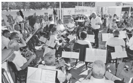
Oktoberfest mit den Oldies vom Musikverein Güglingen in der „Weinsteige“.