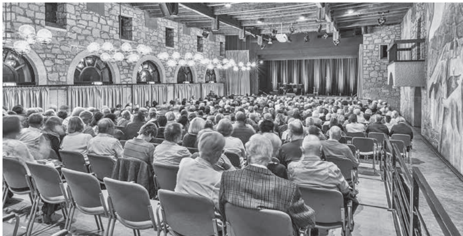
Volle Ränge zum Start der Spielzeit in der Herzogskelter.

Seit mind. 3 Monaten in Baden-Württemberg wohnhaft/gemeldet