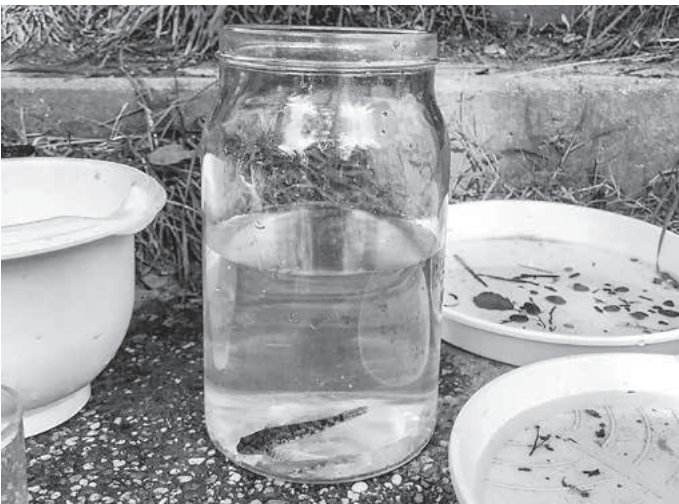
... bringt die Zaber so einiges Spannende hervor.