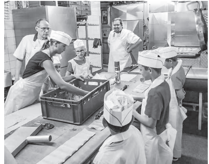
Mit Unterstützung der Meister entstehen leckere Maultaschen.