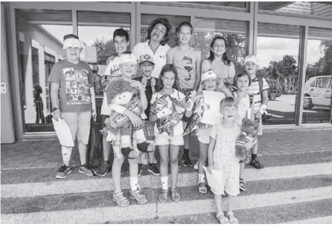
... auch das Anlegen von Verbänden wurde von den jungen Ersthelfern geprobt.