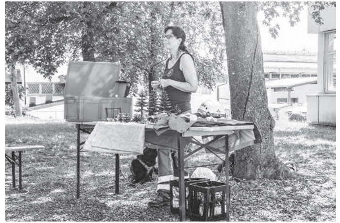
Nach der Theorie ...