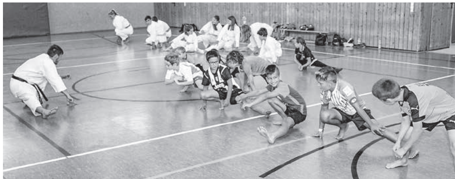
Ohne Aufwärmübungen geht es beim Karate nicht.