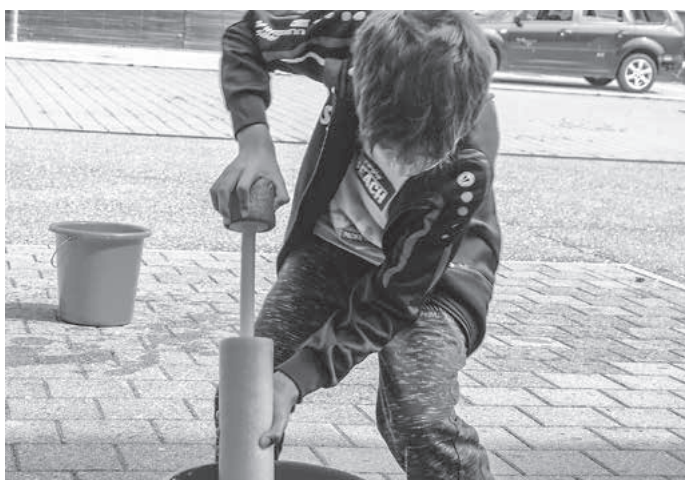
... fleißig beim Üben.