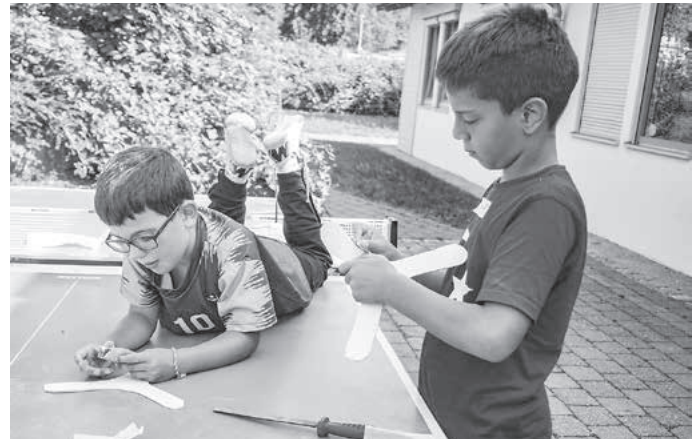
... wird für den perfekten Bumerang kräftig geschmirgelt.