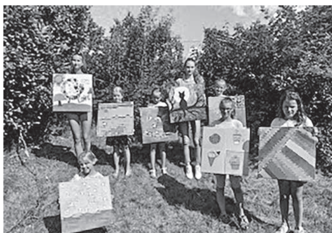
Auch in diesem Jahr sind beim Acrylworkshop wieder wahre Kunstwerke entstanden.