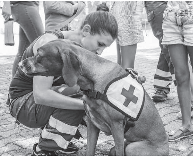
... zeigen die Hunde der Rettungshundstaffel auch in der Praxis ihr Können.