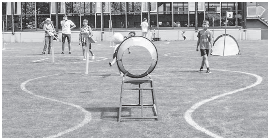
Ballgefühl war beim Fußballgolf in Frauenzimmern gefragt.