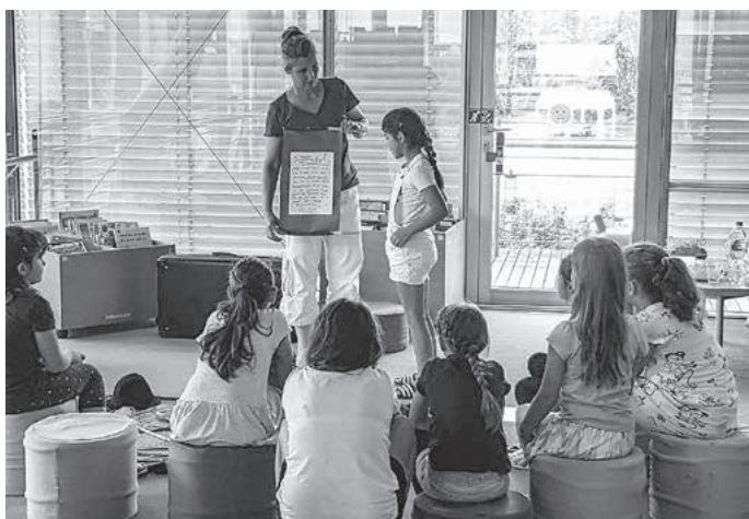
Lasst uns beim Live-Hörspiel gemeinsam in die Welt der Geräusche und Römer eintauchen.