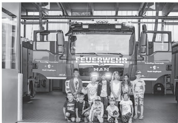
Die künftigen Feuerwehrmänner und -frauen ...