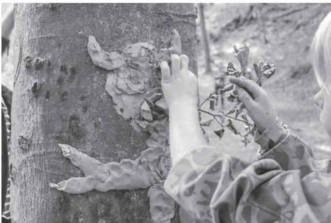
Die Waldgeister der Burgruine Blankenhorn ...

Mehr Bildeindrücke des Ferienprogramms finden Sie ab Anfang September auf der Homepage der Stadt Güglingen unter www.gueglingen.de