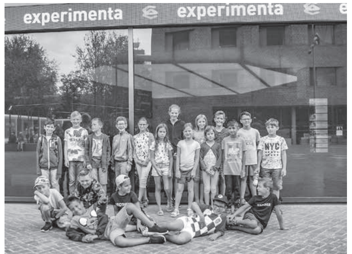
Die Forschergruppe der Experimenta.