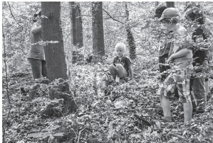
... bevor wir schauen, wer die ultimative Kugelbahn gebaut hat.