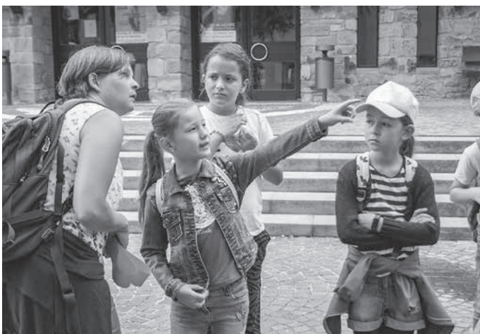
Bei der Stadtführung gibt es für alle Neues zu entdecken.