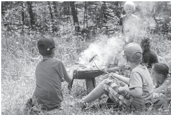
Eine Stärkung zwischendurch darf nicht fehlen ...