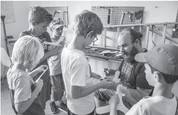
Nach einer kurzen Einführung ...