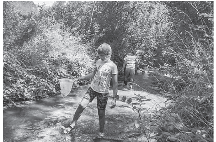
Mit Kescher und Becherlupe ...