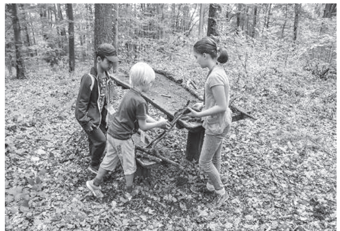
Für unsere Kugelbahn müssen wir zuerst die passenden Materialien suchen.