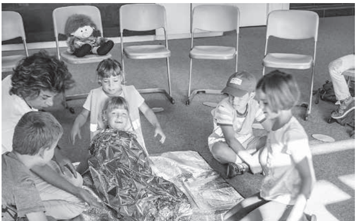
Nicht nur der richtige Umgang mit der Rettungsdecke ...