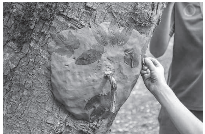
... werden mit Ton und Naturmaterialien zum Leben erweckt.