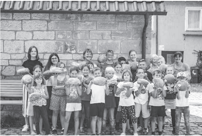
... und für sehr gut befunden!