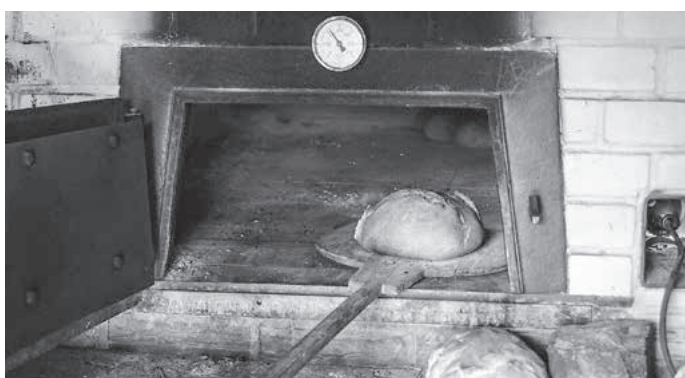
Mit der richtigen Temperatur entstehen im Backhaus leckere Pizza, Brote und süße Kuchen.