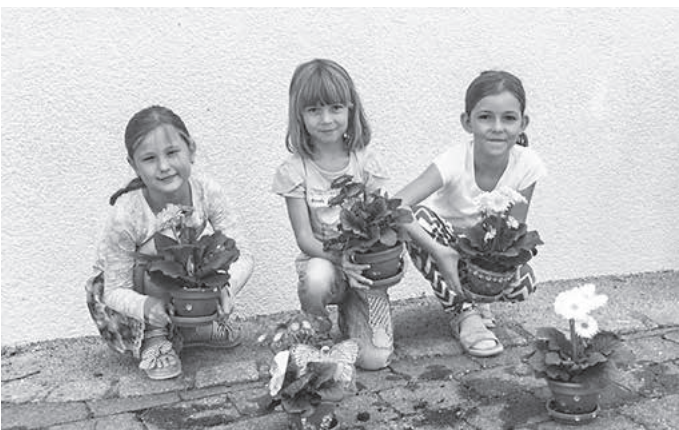
Stolz werden die selbst gestalteten Blumentöpfe präsentiert.