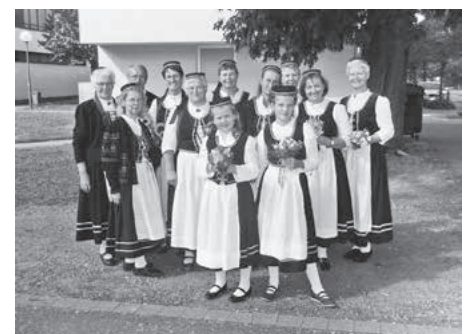
Auch in Karlsruhe war die Trachtengruppe dabei.