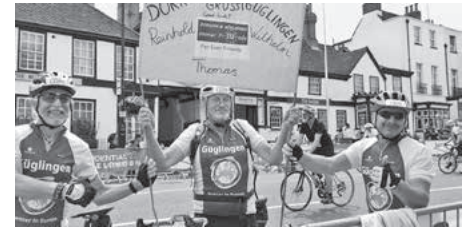
Begrüßung in Dorking

Das Highlight am 4. August 2019 war dann das Radspektakel – Prudential Ridelondon Surrey 100 – mit über 30.000 Teilnehmern, startend im Olympia-Park London mit dem Ziel Dorking und seinen zahlreichen Erhebungen überwindend, die uns durch Katherine Walker bereits bekannt waren sowie endend mit Zieleinlauf in The Mall gegenüber dem Buckingham Palace und der Festival Zone im Green Park. Die Route entsprach dem Straßenrennen der Olympischen Spiele 2012 in London.