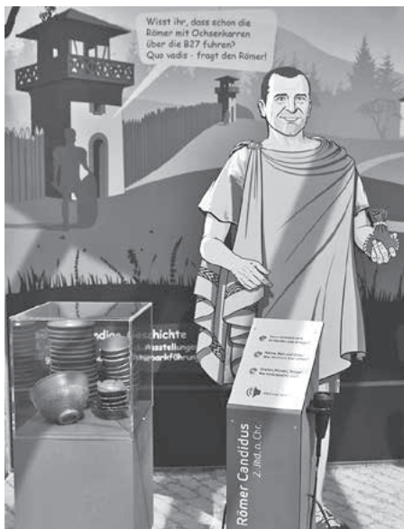
Ständiger Botschafter Güglingens auf der BUGA im Landkreis-Pavillon: Der Römer Candidus, ein wohlhabender Händler und Mithras-Anhänger.

Am Dienstag, den 16. Juli findet kein Treffen statt. Unser letzter Termin vor den Sommerferien ist der 23. Juli. Da kommt Frau Röbbig mit Flötenkindern zu uns in den Pavillon.