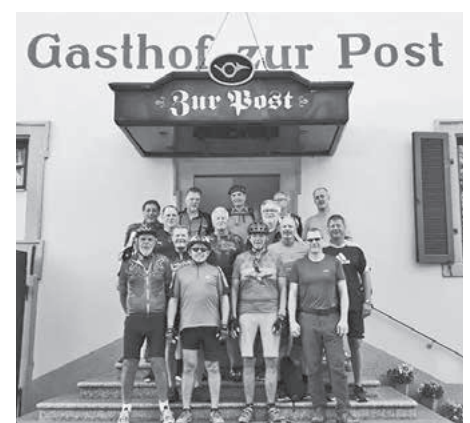
Vor dem Gasthof zur Post in Schöntal formierten sich die TSV-Radler zum Gruppenfoto.

Über 500 Höhenmeter warteten auf die Pedaleure am zweiten Tag. Über Krautheim und Dörzbach ging es zum Kocher nach Künzelsau. Es folgten die Orte Ingelfingen und Niedernhall, ehe nach 55 km das Etappenziel Forchtenberg in Sicht kam. Nicht nur das Wetter meinte es gut mit den TSVlern. Der Zufall wollte es auch, dass in den malerischen Gässchen der Altstadt ein Straßenfest für prächtige Stimmung sorgte. Im Quartier "El Greco" ließen sich die hungarischen Radler griechische Spezialitäten munden. Die Schlussetappe (78 km) geriet zur Hitzeschlacht. Hardthausen und Neuenstadt pasierten die TSVler, dann lockte in Jagstfeld wieder der Biergarten. Zum Abschluss glich die Truppe in der Krone in Güglingen den enormen Flüssigkeitsverlust vollends aus.