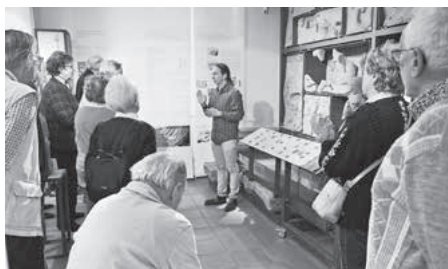
Besuchergruppe aus Bad Cannstatt bei der 1.500sten Führung.

Ein überaus freudiges Ereignis stand dem Römermuseum vor wenigen Tagen ins Haus – die nunmehr bereits 1.500ste Führung! Die glücklichen Teilnehmer dieser Führung durch die Dauerausstellung gehörten zu einer sehr kulturbereiterten und vielseitig interessierten Besuchergruppe aus Bad Cannstatt. Die Gäste verbrachten, vom Neckar-Zaber-Tourismus organisiert, einen dreitägigen Aufenthalt im Zabergäu, übernachteten in Clebronn und nahmen hier vielfältige touristische Angebote wahr.