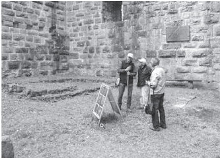
1. Mai 2018

Natürlich bieten wir auch an diesem Tag bei Interesse kostenlose Burgführungen an. Die Bewirtung mit Getränken und Roten Würsten übernehmen die Fußballer des GSV Eibensbach. Vielleicht haben Sie ja auch Interesse, sich in welcher Form auch immer bei der IGBB einzubringen. Wir freuen uns über jeden Mitstreiter, jede Hilfe ist willkommen!