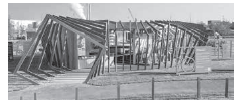
Der Pavillon des Landkreises Heilbronn auf der BUGA

Mit einem modernen Holzpavillon präsentiert sich der Landkreis Heilbronn auf der Bundesgartenschau und ist Teil des Ausstellungsbeitrags „Made in Heilbronn-Franken“. Am vergangenen Donnerstag wurde der Pavillon nun offiziell freigegeben.