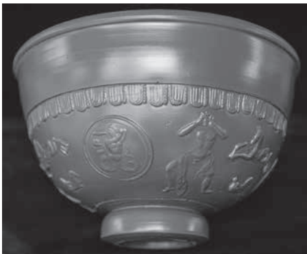
Bildpunzen auf der Schüssel zeigen das Seeungeheuer Skylia und den geblendeten Kyklopen Polyphem, umgeben von mythischen Meerwesen

Die Nachbildungen in der BUGA-Vitrine zeigen eindrücklich, wie streng normiert dieses römische Geschirr in Formen und Größen war (gewissermaßen das römische IKEA-Geschirr) und so leuchtet es ein, dass im Rahmen einer vorindustriellen Massenproduktion die Manufaktur in Rheinzabern während den 80 Jahren ihres Bestehens rund 50 Millionen Gefäße produziert hat.