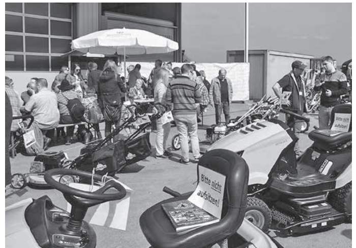
Das Firmengelände in der Rodbachstraße 39 verwandelte sich in einen Festplatz.