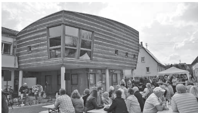
Auf dem Platz vor dem Rathaus war beim Pfaffenhofener Frühling viel los.

Ein weiterer Treffpunkt war beim Bekleidungshaus Holzhäuer, dort konnte man neben einer Plauderrunde beim Bier sich über die neuesten Kollektionen informieren und auch kaufen.