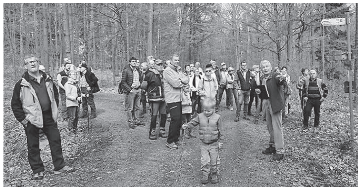
Wanderer in Pfaffenhofen

Neckar-Zaber-Tourismus e. V., Heilbronner Straße 36, 74336 Brackenheim, Telefon 07135/933525, info@neckar-zaber-tourismus.de , www.neckar-zaber-tourismus.de . ÖZ: Mo., 9–13 Uhr, Di.–Fr., 9–18 Uhr; Sa., 10–13 Uhr.