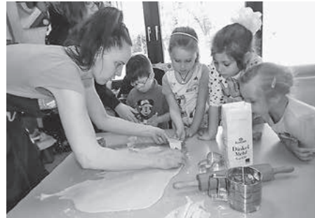
Eine Mutter hatte sich bereit erklärt Osterhasen und Eier aus Hefeteig zu backen.