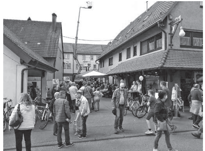
Auch im Hof der Fa. Böckle war einiges geboten.

Ein Angebot an Schmuck und Informationen zur richtigen Fußpflege rundeten das Angebot ab. (Text: Ines Schmiedel, HGV u. bma)