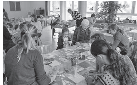
Bei diesem Angebot wurde eine Hasengeschichte verklungen und tolle Holzhasen gestaltet.