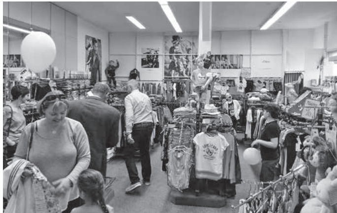
Auch das Modehaus Holzhäuer hatte viel zu bieten.

Schließlich gab es in der Zeitlorstraße noch einen weiteren Sammelpunkt mehrerer Mitglieder des Handels- und Gewerbevereins Pfaffenhofen. Neben guter Beratung im Elektrogeschäft der Fa. Böckle gab es noch köstliches vom Hofladen Volland, Säfte von Pur-Safta und köstlicher Wein von den Weingärtnern Cleebrohn-Güglingen zu probieren.