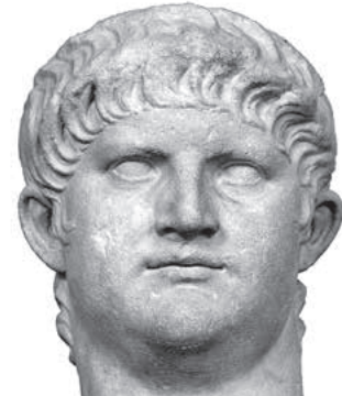
Kaiser Nero (54–68 n. Chr.): Kopf einer überlebensgroßen Skulptur in der Glyptothek, München

neben Nero mit den oft als ebenso wahnsinnig geltenden Kaisern Caligula, Commodus oder Caracalla. In allen vereint sich ein extrovanter Charakterzug mit äußerster Brutalität, so dass beispielsweise Nero nicht nur seine Ehefrau, sondern auch seine Mutter ermorden ließ. Anhand ausgewählter Exponate wird der Grundlage der Vergöttlichung der Kaiser nachgegangen; darüber hinaus werden einzelne, besonders bekanntgewordene Episoden aus deren Handeln thematisiert und auch gedeutet.