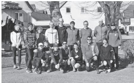
Erster Testlauf für den Zabergäu-Lauf 2019, der Zweite wird bald folgen.

Eine muntere Läuferchar fand sich vergangenen Sonntag zum ersten Test für den Zabergäu-Lauf ein. Es gibt noch eine zweite Möglichkeit zum Üben auf den Strecken 1,5 km, 5 km, 10 km und 18,5 km und zwar am Samstag, 13. April, um 10 Uhr. Treffpunkt ist beim Rathaus.