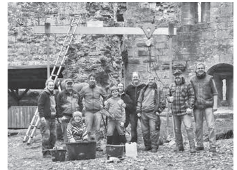
Sanierungsarbeiten November 2018

Wir freuen uns auf Ihr Kommen und Ihre Mitarbeit.