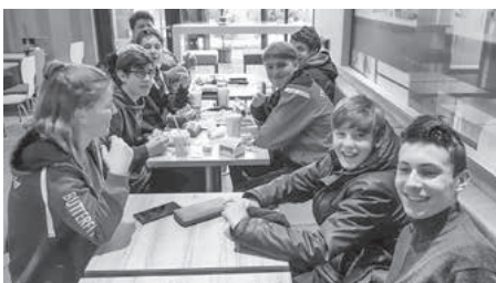
Die beiden Teams feiern ihren Sieg bzw. die Teilnahme am Turnier