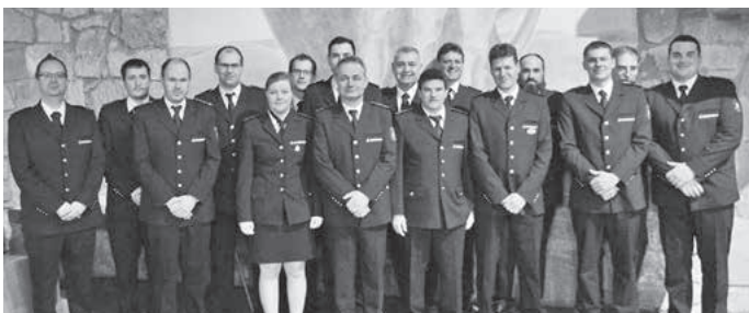
Die neu gewählten Ausschussmitglieder.

Auch die anschließenden Wahlen des Feuerwehrausschusses gingen reibungslos über die Bühne.