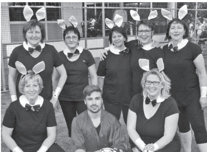
Auch Damenteam nehmen am 4. Flutlicht-Elfmeterturnier des TSV Pfaffenhofen teil.

Zum vierten Mal trägt der TSV Pfaffenhofen sein Flutlicht-Elfmeterturnier aus. Der Verein hofft auf eine ähnlich gute Resonanz wie in den vergangenen Jahren. Der Wettbewerb wird um 19 Uhr mit den Gruppenspielen eröffnet. Danach folgt mit der K.-o.-Runde die heiße Phase, bei der rund um den Festplatz Hochstimmung herrscht. Das große Finale wird gegen Mitternacht angepiffen. Jede Mannschaft hat fünf Schützen. Verwandelt ein Team alle fünf Versuche, warten an der Bar Freigetränke. Komplette Frauenteam erhalten vor jeder Partie als Zielwasser eine Flasche Hugo, Sekt oder ein alkoholfreies Getränk.