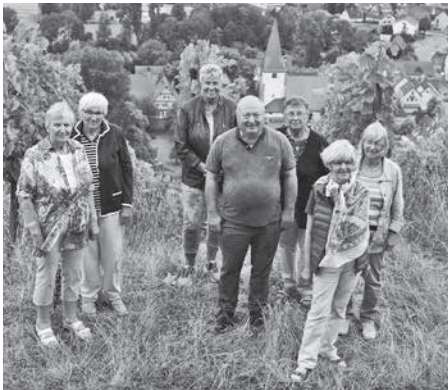
Die Teilnehmer an jener prominenten Stelle, wo sich über der Pfaffenhofer Ortsmitte die Gugglinger Richtstätte erhob.

Hinaus ging es dann entlang des Weges, den die Hinzurichtenden aus eigener Kraft zurückzulegen hatten, zunächst zum Friedhof und Schlusspunkt der geführten Tour war der Gugglinger Galgen: Am Heuchelbergtrand hoch über Pfaffenhofen befand sich die Hinrichtungsstätte, in der viele schuldig Gesprochene auf unterschiedlichste Weise aus dem Leben schieden – unter stets großer Anteilnahme der Bevölkerung aus Nah und Fern und mit regelrechtem Volksfestcharakter. Deren sterbliche Reste liegen dort bis auf den heutigen Tag verscharrt, denn in geweihter Erde durften sie keinesfalls bestattet werden.