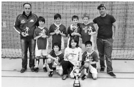
Die erfolgreiche Mannschaft im Bild.

Im Viertelfinale konnte man die Gastgeber vom TSV Talheim mit 2:1 bezwingen. Im Halbfinale gegen den Favoriten TSV Weinsberg stand es nach regulärer Spielzeit 0:0. Im Neunmeter-schießen hatten wir diesmal das Glück auf unserer Seite und gewannen mit 4:2. Wobei unserer Torhüter Berki mit drei gehaltenen Neunmetern glänzte.