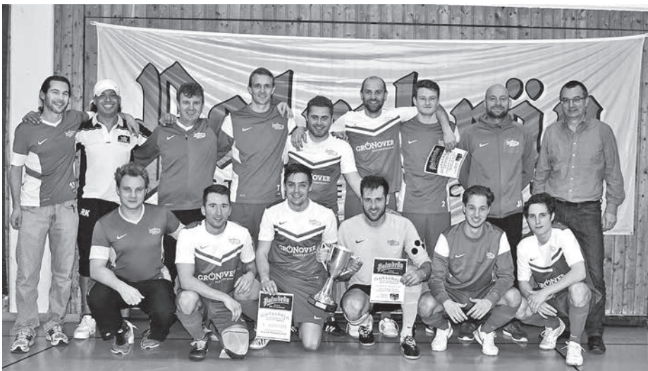
Flotte und torreiche Spiele mit insgesamt 86 Toren gab es beim 12. Palmbräu-Cup in der Güglinger Sporthalle. Am Ende hieß der Sieger TSV Güglingen.