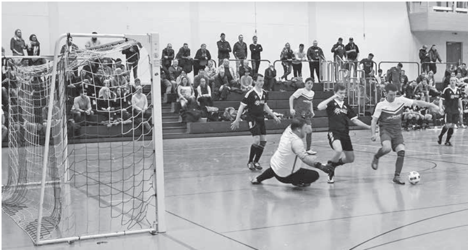
Im Endspiel (unser Bild) konnte sich der TSV Güglingen gegen die Sportfreunde Lauffen mit 6:2 durchsetzen.