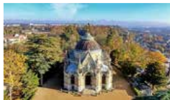
Die Domaine Royale in Dreux

Es gibt noch freie Plätze für unsere Fahrt nach Auneau vom 27. bis 30. Juni 2024.