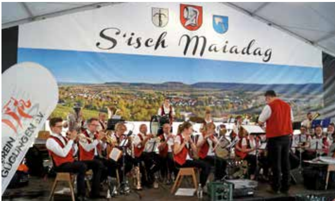
Im Festzelt wird viel Unterhaltungsmusik geboten, beispielsweise durch den MV Güglingen und viele andere Musikvereine aus der Umgebung.