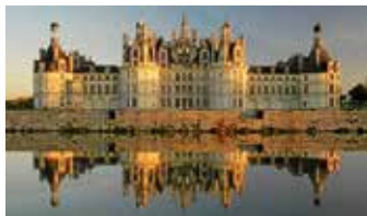
Das Loire-Schloss Chambord