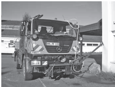
Markus Kochert beim Gießen der Pflanzen auf dem Schulhof

Die Sommer- bzw. Ferienzeit gibt die Gelegenheit zur intensiven Grün- und Landschaftspflege für das Gemeindegebiet. Die Mitarbeiter nutzen die Urlaubszeit zum Schneiden der Hecken, Gießen der Pflanzen und Sträucher, Mäharbeiten, Pflege der Spielplätze und vieles mehr.