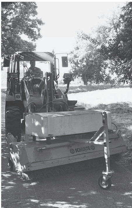
Daniel Koch beim Reinigen der Feldwege in Weiler

Die Sommer- bzw. Ferienzeit gibt die Gelegenheit zur intensiven Grün- und Landschaftspflege für das Gemeindegebiet. Die Mitarbeiter nutzen die Urlaubszeit zum Schneiden der Hecken, Gießen der Pflanzen und Sträucher, Mäharbeiten, Pflege der Spielplätze und vieles mehr.