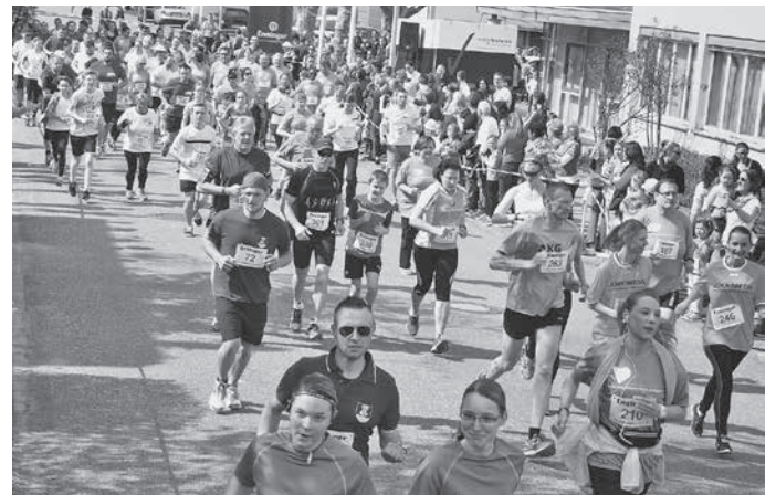
Start Jedermann- und Firmenlauf