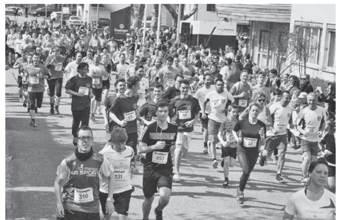
Start Hauptlauf und Dinosaurier-Challenge