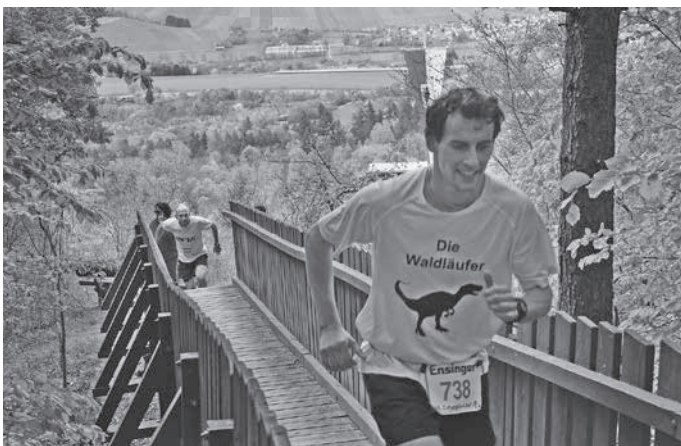
Blick von der Brücke am Weißen Steinbruch auf Gemeindefahne und Gemeinde