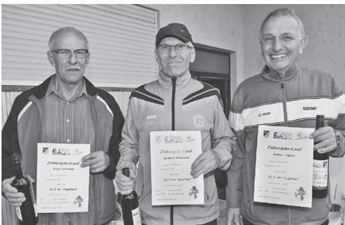
Älteste Teilnehmer des Hauptlaufs Jahrgänge 70 (links und rechts) und in der Mitte Jahrgang 80