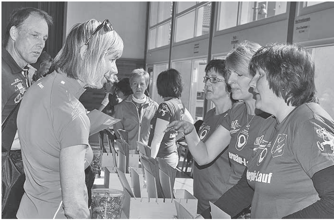
Ausgabe der Startnummern