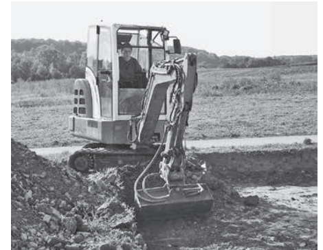
Nicht nur mit Pinsel und Feinwerkzeug: Auch größeres Gerät kommt in der Archäologie zum Einsatz.

16. Juli um „Die Abenteuer des Odysseus“ . Diese vier Veranstaltungen sind so konzipiert, dass ihre erste Hälfte aus einem erzählerischen Teil besteht und sich dann nach einer Pause eine passende Aktiveinheit anschließt.