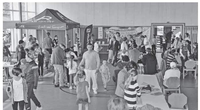
Anmeldung in der Wilhelm-Widmaier Halle