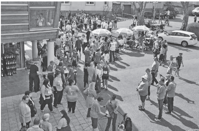
Vor der Startaufstellung