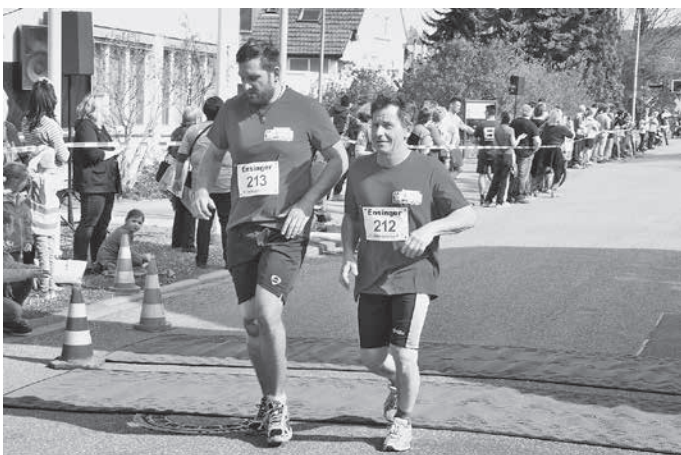
Team Gemeinde im Ziel