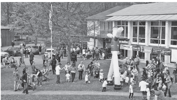
Vorbereitung vor dem Start

562, 548, 546, 570 und nun 545 – das sind die Werte der letzten fünf Jahre.