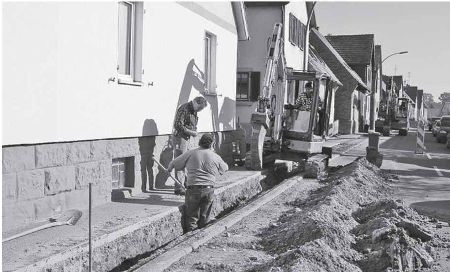
Mit Behinderungen müssen derzeit die Anlieger und Verkehrsteilnehmer in der Zaberfelder Straße in Weiler rechnen.

Eine Baustelle mit halbseitiger Straßensperrung behindert derzeit den Verkehr in der Ortsdurchfahrt von Pfaffenhofen-Weiler. Später sind auch der landwirtschaftliche Verkehr und die Radfahrer entlang der Zaber zwischen Weiler und Pfaffenhofen davon betroffen. Im Auftrag der EnBW ist die Firma Lienhard aus Waldshut-Tiengen gerade damit beschäftigt, von Leonbronn über Zaberfeld und durch Weiler bis nach Pfaffenhofen neue, so genannte Mittelspannungskabel für 20.000 Volt (20 KV) zu verlegen. Die neuen Erdkabel ersetzen nach ihrer Fertigstellung die längs durchs Obere Zabergäu verlaufende Freileitungslinie, die bisher die Trafostationen in den Ortsteilen mit Strom versorgt hat. Am meisten betroffen und behindert von den Bauarbeiten sind in diesen Tagen die Anwohner der Zaberfelder Straße in Weiler. Dort führt die Trasse vom Ortseingang auf dem Gehweg entlang bis zur Zaberstraße und weiter bis zur Trafostation neben der Metzgerei Grauer. Von dieser Station wird dann ein Kabel über den Bahnhofplatz, am Backhaus vorbei, die Bra-