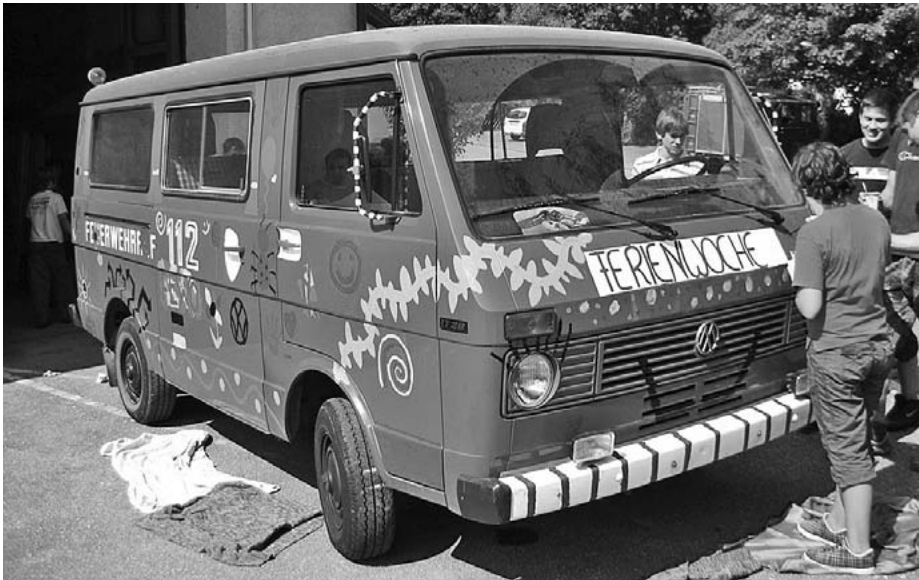
Der Bus erhält ein neues Gesicht.

Leider fehlte für das eine oder andere Detail dann die Zeit, was man aber im Rahmen der diesjährigen Ferienwoche noch nachholen möchte.