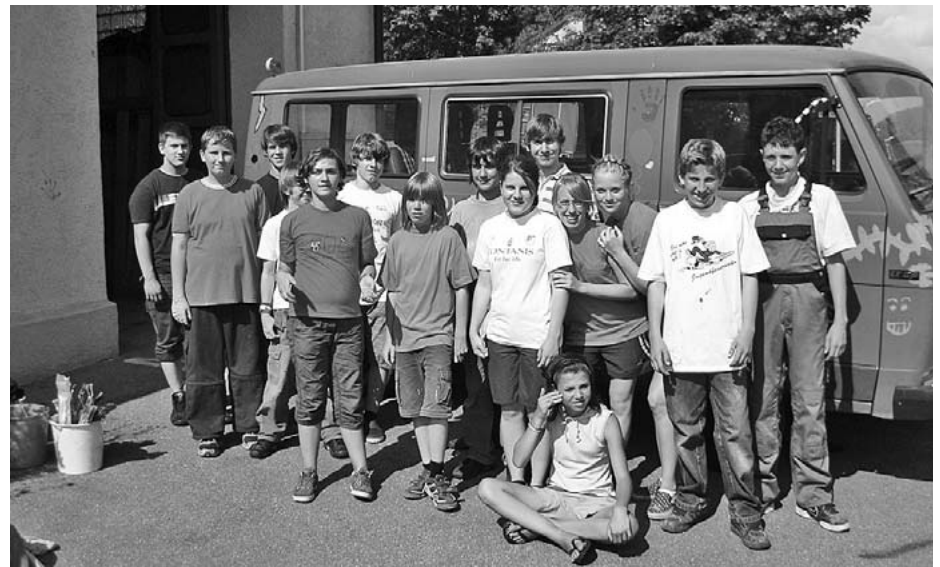
Das Malerteam der Jugendfeuerwehr.

Der, lange Jahre bei der Ferienwoche in Pfaffenhofen eingesetzte, Mannschaftstransportwagen der Freiwilligen Feuerwehr hatte eigentlich schon ausgedient und sollte verkauft werden. Nach einigen Überlegungen kam man auf die Idee, das Fahrzeug doch noch einmal über eine Kurzzulassung anzumelden und bei der diesjährigen Ferienwoche einzusetzen. Damit der offizielle Charakter eines Feuerwehrfahrzeuges etwas verschwindet, hat man sich entschlossen, den Wagen durch die Jugendfeuerwehr umzugestalten. So traf man sich im Rahmen einer Jugendfeuerwehrübung, um mit Farbe und Pinsel bewaffnet, dem alten Feuerwehrbus ein neues Gesicht zu verpassen. Mit viel Spaß gingen die 15 Jugendlichen ans Werk und ließen ihrer Phantasie freien Lauf.