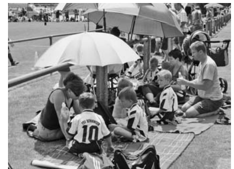
Während der Hitzeschlacht verschafften Mütter und Betreuer ihren Schützlingen Schatten und Erfrischung.

Die wilde Torejagd der Jüngsten begeisterte die Zuschauer einmal mehr. Den Turniersieg bei den Bambini sicherten sich der TSV Benningen vor dem TSV Güglingen, TSV Talheim, Gastgeber Pfaffenhofen und SC Oberes Zabergäu.