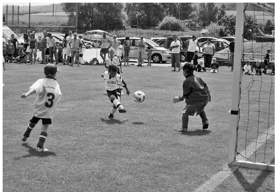
Der Nachwuchs auf Torejagd: Früh übt sich, wer ein Großer werden will.

Die wilde Torejagd der Jüngsten begeisterte die Zuschauer einmal mehr. Den Turniersieg bei den Bambini sicherten sich der TSV Benningen vor dem TSV Güglingen, TSV Talheim, Gastgeber Pfaffenhofen und SC Oberes Zabergäu.