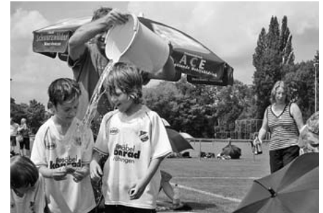
Die Youngster des SV Illerzell genießen die kühle Dusche zwischen zwei Turnierspielen.

Die Sonne lachte, als beim Fußball-Sommerfest des TSV Pfaffenhofen um Pokale und Preise gekickt wurde. Von den Bambini bis zu den „Alten Herren“ waren alle Altersklassen auf dem Sportplatz im Tal am Ball.